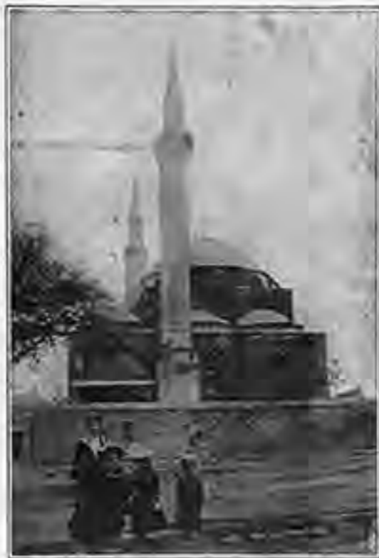
ΤΕΜΕΝΟΣ ΜΟΥΡΑΔΙΕ ΕΝ ΜΑΓΝΗΣΙΑ