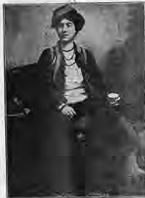
ΑΝΑΤΟΛΙΤΙΣΣΑ Ἐκ τῶν περιηγήσεων τῆς ζωῆς

«Ὁ ἀκόληξ ἀφ' οὗ καλυπθῆ ἐπὶ τῆς γῆς, ἀφ' οὗ τραπῆ διὰ πικρῶν χόρτων καὶ πυρρῆ εἰς τὸν βόρβορον τῶν ἐλῶν καὶ τὸν κοινοτῶν τῶν δρόμων, θάπτεται εἰς τὸ βομβυκίον του. Ἀλλὰ θὰ ἐξέλθῃ ἐξ αὐτοῦ καθαρός καὶ μεταμετριοποιημένος ὡτως πετάξῃ ὑπὸ ἄνθος εἰς ἄνθος, ζῆση ἐκ τοῦ ἀρώματος αὐτοῦ, καὶ ἀνοίγων δύο ὄραίας πύργους, ὡς οὐδὴ πρὸς τὸν οὐρανόν. — Ἡ ἱστορία τοῦ ἀκόληκος εἶνε ἡ ἱστορία τοῦ ἀνθρώπου, ὅστις ἀφ' οὗ ζῆση ἐν μέσῳ τῶν πικριῶν καὶ τῶν ταπεινώσεων, δὲν χάνεται ἐν τῷ τάφῳ ἀλλ' ἀναγεννᾶται διὰ τοῦ θανάτου ὡς ἄλλη Ψυχὴ, ὡς ἄλλος ἀγγελος.»