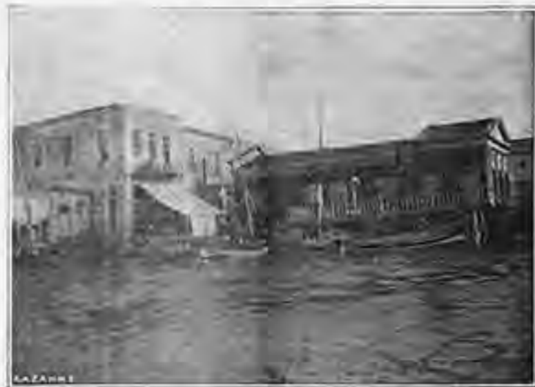
ΠΑΡΑΛΙΑΚΑ ΚΑΦΕΝΕΙΑ ΚΥΔΩΝΙΩΝ